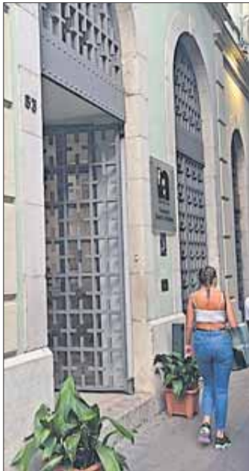
La Fundació Clerch i Nicolau.