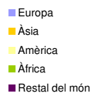
Persones estrangeres per nacionalitat. Figueres, desembre 2012.